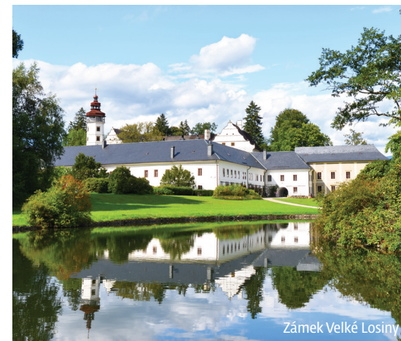
Zámek Velké Losiny

Víte, že snadno získáte i další tipy na výlety po Olomouckém kraji? Stačí navštívit webové stránky www.ok-tourism.cz nebo využít služeb turistických a informačních center.